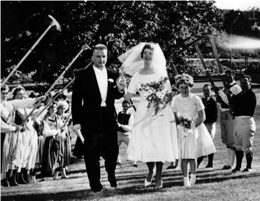
Sommarbröllop vid Nacka kyrka med gammeldansare från Nacka Hembygdsförening paraderande den 1 juli 1961.