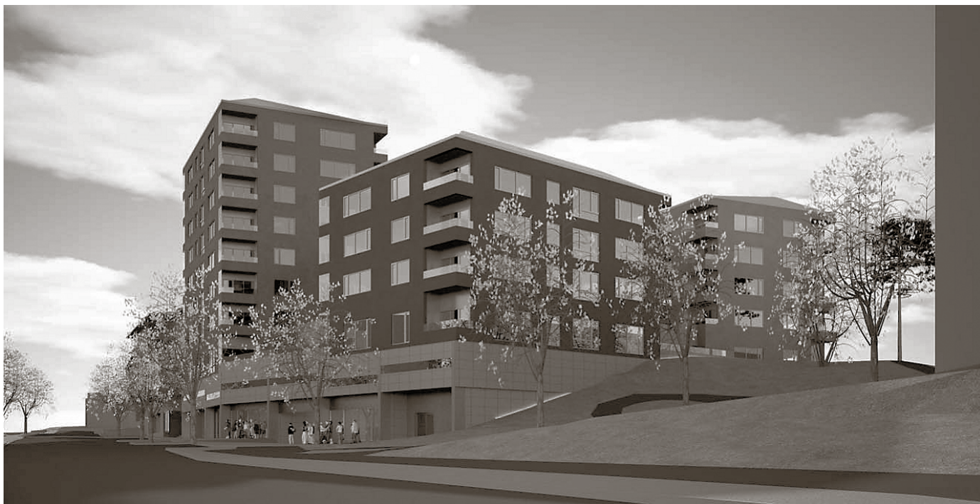
Perspektiv med Dalgränd i förgrunden mot söder. BSK Arkitekter AB.