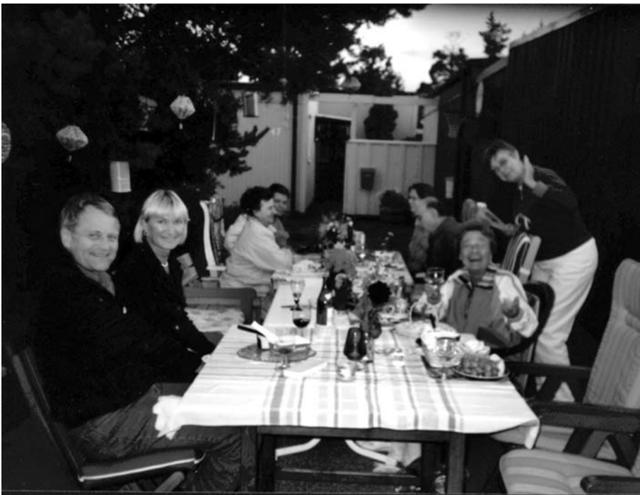
Fest på Lummergången med grannar och vänner.

Nåväl, paret bodde först på Bollmoravägen 10 dit de flyttade 1961 den 1 juli i samband med bröllopet. Sen flyttade de till Sikvägen 21 1965 och 1969 köpte de radhus på Lummergången 51 och dit kom de 13 december 1970. Där bodde de i 37 år innan flytten till Sikvägen 51