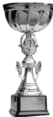
Södertörnsmästarpokalen vanns 2008 av PRO-Tyresö!