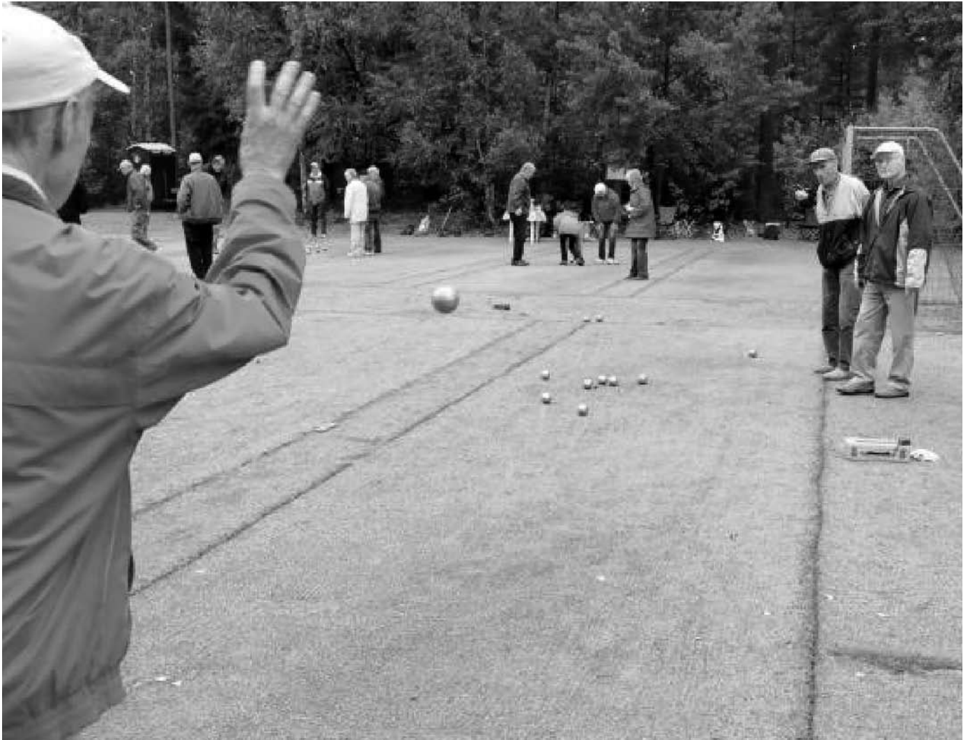
Boule, en svår sport om man vill komma långt.