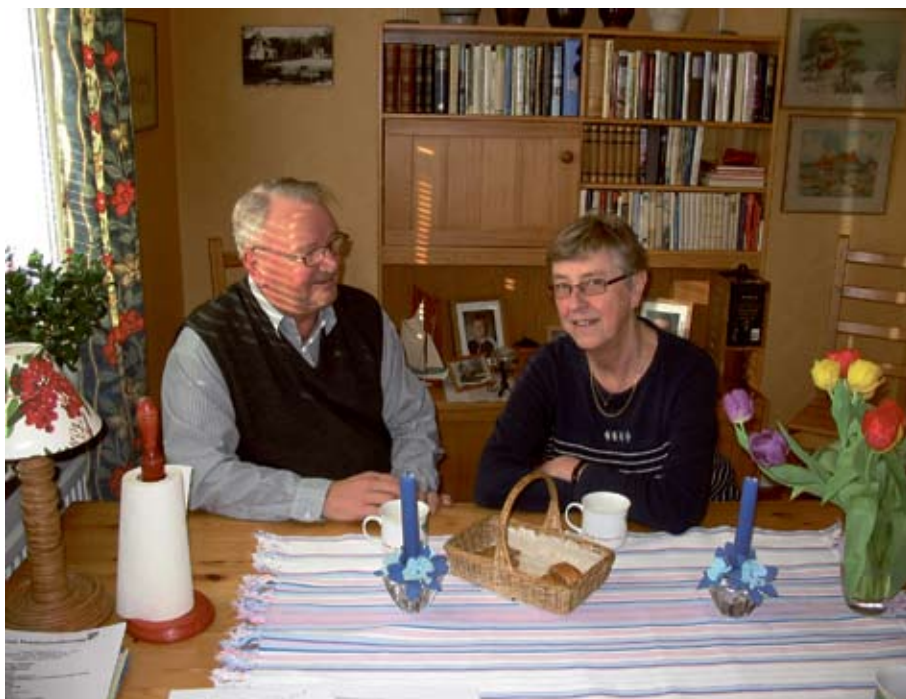
Som vanligt är det vid köksbordet som alla viktiga beslut tas.

Hon fick jobb på Sthlms stads Yrkeskolor på Polhemsgatan 1956. Gick över till Sthlms stads Sjukvårdsstyrelse 1959.