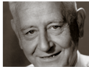
Jules Sylvain hette egentligen Sven Hansson.