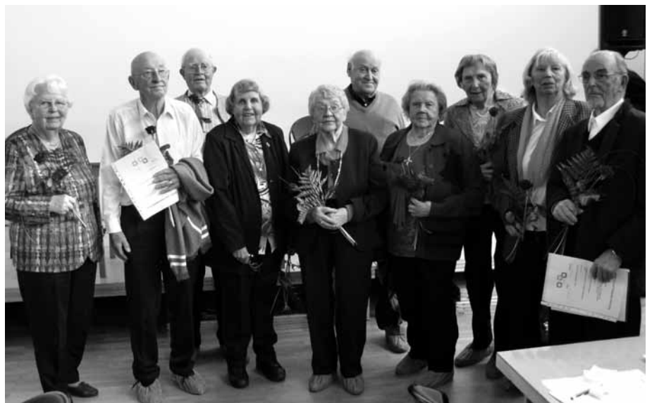
Här är tio av dem som utnämndes till Hedersmedlemmar. Totalt var det 24 personer som fick den stora äran.