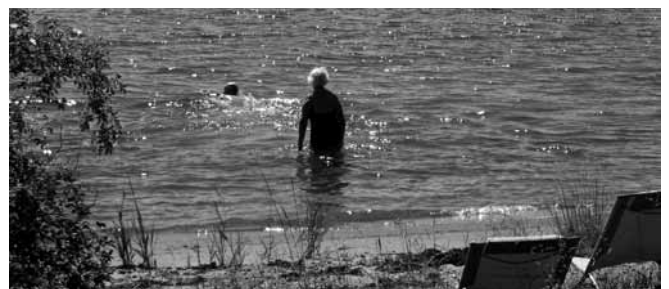
Vilka minns den förra utflykten till Svartsö, de badande kanske.

Vi reser på skärgårdstutflykt till Svartsö tisdagen den 29 juni 2010. Förra gången, i slutet av juni 2008, hade vi tur med vädret. Hoppas på samma tur denna gång. Efter båtresan väntar 8 km. promenad. Vi reser med buss till Nackastrand och tar båten där till Svartsö. Närmare information kommer på månadsmöten i april och maj.