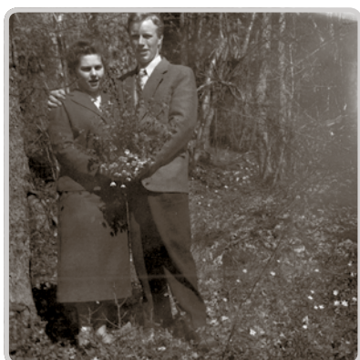
Paret förlovade sig vid Fatburen 1955.