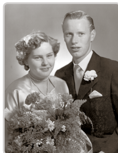
Bröllopskortet från 1955.