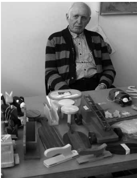
En glad PRO-snickare bjuder ut sina alster till försäljning.