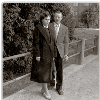
Första lysningsdagen 1955 vid Högalidskyrkan.