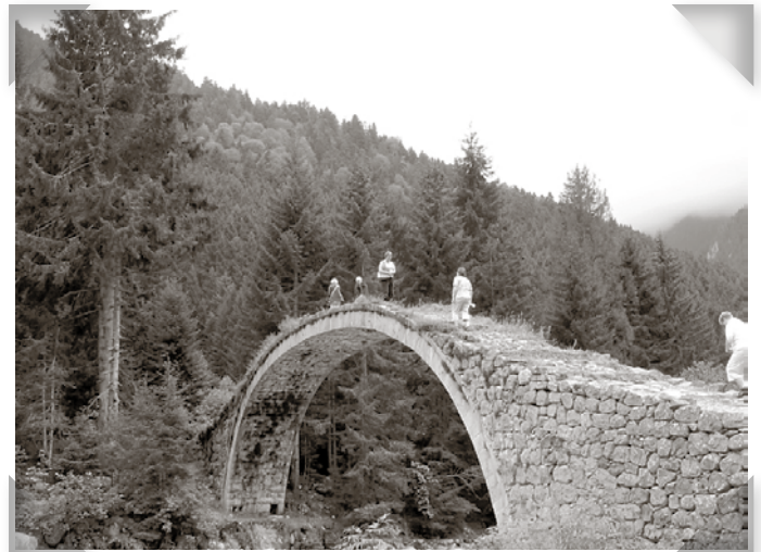
De fantastiska stenbroarna.