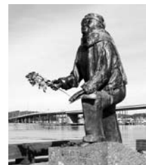
Från Packhuskajen blickar Evert Taube västerut mot sin barndoms älskade Vinga. Skulptur gjord av Eino Hanski.