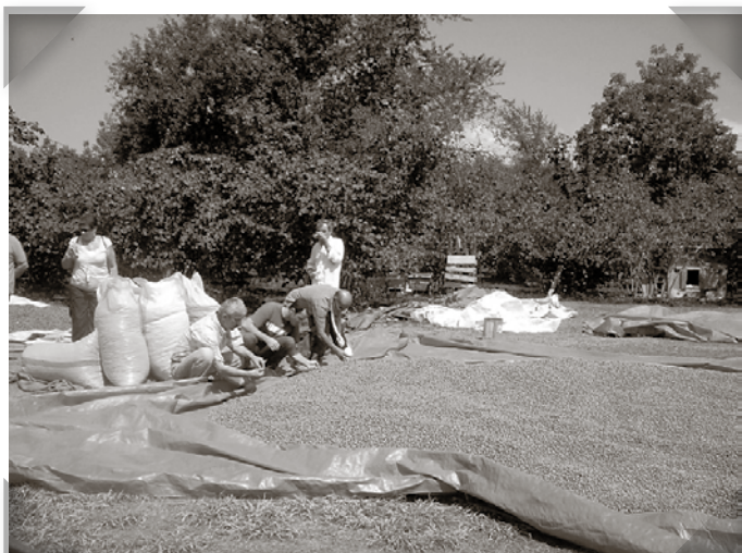
Turkiet är världens största producent av hasselnötter.