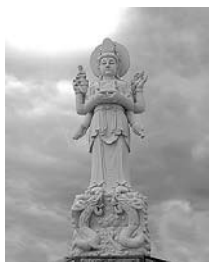
Staty av Guanyin.