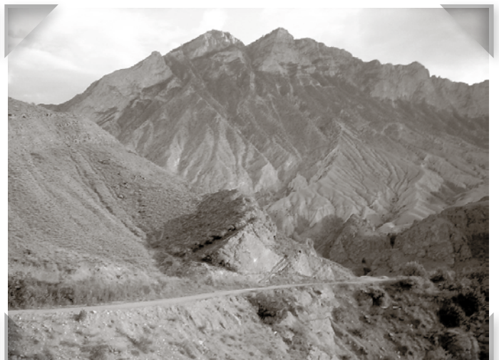
Bergens karaktär förändrades ständigt.