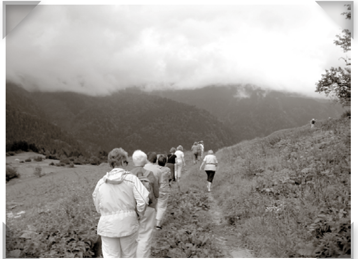
Raka led på väg till buske 7, om ni förstår vad jag menar...