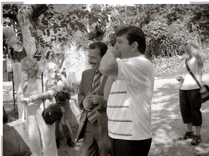
Visslande berättade guiden att vi var på väg.