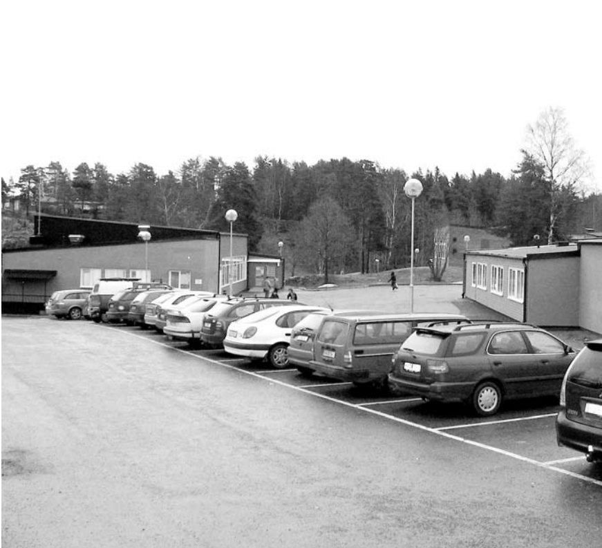
Vem ska få kvällens sista lediga ruta?