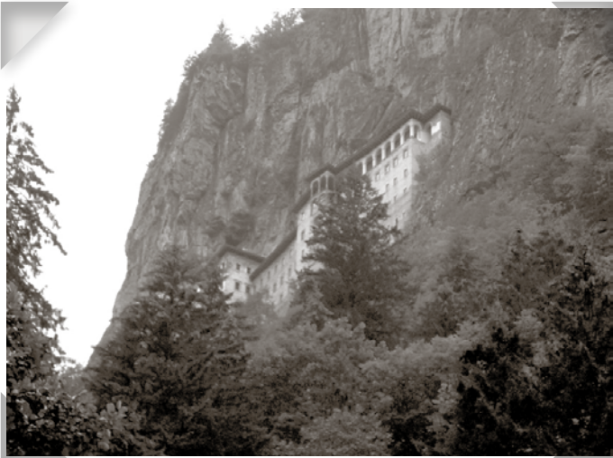
Oj, vilken upplevelse! Klostret grundlades på 300-talet.