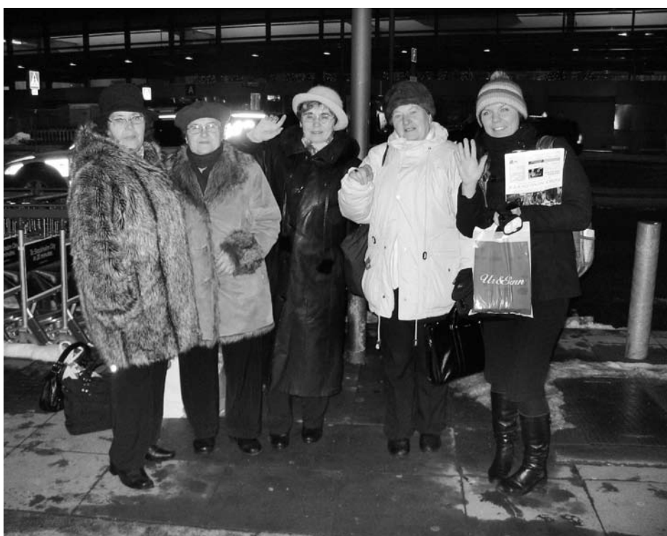
Hela gruppen vinkar adjö vid Arlanda.