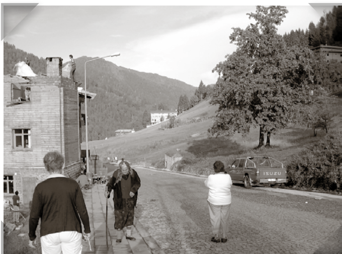
Den lilla gumman kom ner via linbanan i bakgrunden.

Det går inte att beskriva mäktigheten av naturen och synen av det svunna klosterlivet på sådana höjder. Måste bara upplevas!