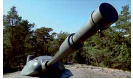
Femörefortet, 7,5 cm halvautomatisk sjömålspjäs m/57.