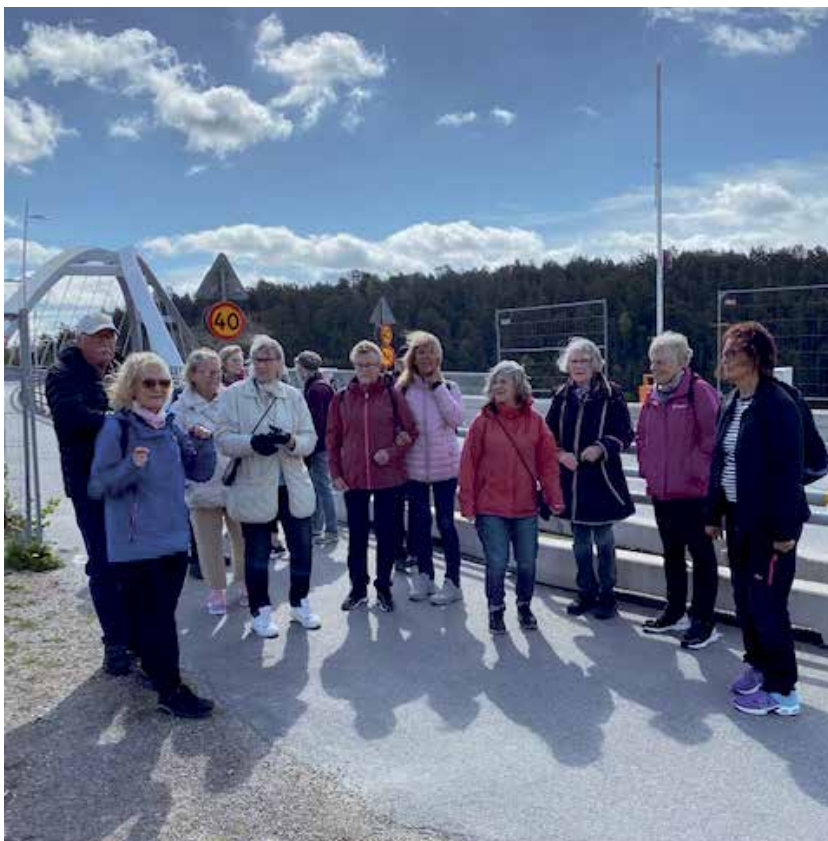
Vi står vid Svindersviksbron. Därifrån gick vi till Hammarby Sjöstad och tog färjan över för en liten lunch.

Oavsett var du har köpt din PRO tripelskrabet, det kan vara via en prenumeration, så tjänar din hemma-förening pengar på att du löser in dina vinster där. Tag med vinstlotter till våra träffar. Se baksidan på lotten för sista giltighetsdatum!