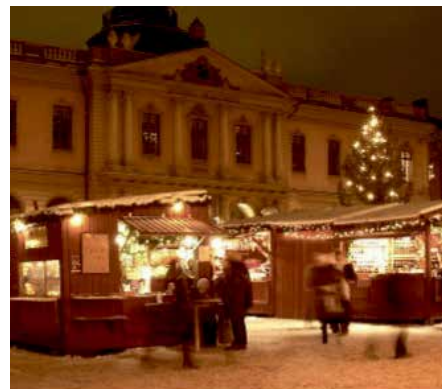
Julbord och julmarknad väntar i Nyköping.