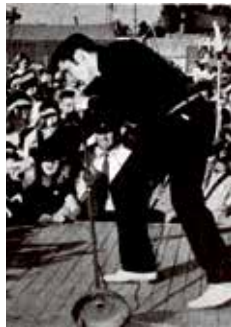
Elvis uppträder live vid "The Mississippi-Alabama Fairgrounds" i Tupelo, Mississippi, i september 1956.