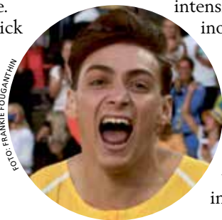
Armand Duplantis höll för trycket och fixade ett av Sveriges tre guld i OS.