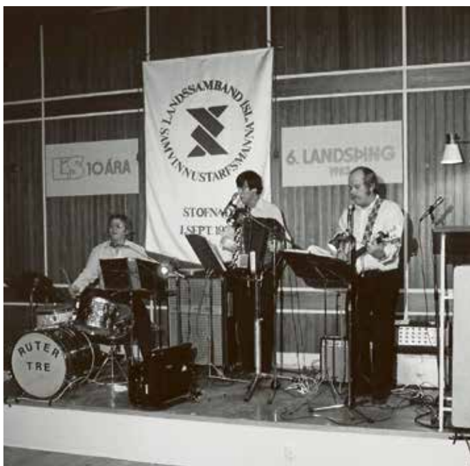
Två resor till Island med eget musikband. Här på kooperativa Skolan Bifrost