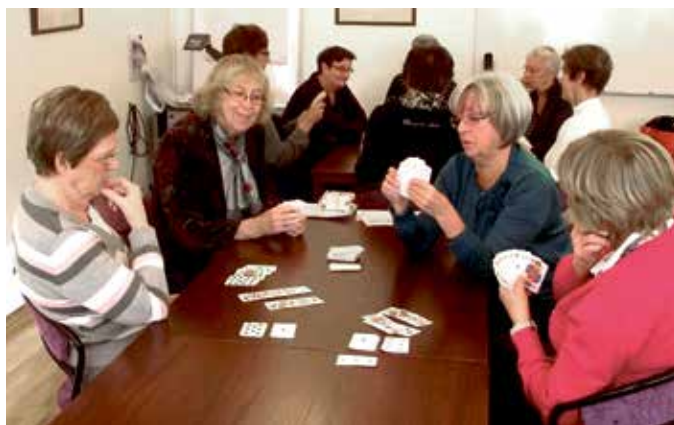
Canasta i PRO Tyresös regi 2014.

Anmälan: till Inger Karlsson tel. 0735-13 51 02 eller Epost: inger@kretavandring.se senast 30 september. Kostnad: 100 kronor via Swish (se telefonnummer ovan) eller till Swedbank bankkonto: 8327-9693646992-0 senast 30 september.