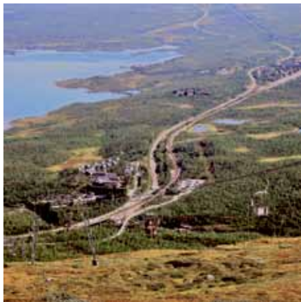
Utsikt från Njulla i Abisko.

Jokkmokk med bland annat same-muséet gav spännande inblickar i den samiska kulturen. Mycket annat var vi med om. Levande vägrenar, läcker fjällröding och ett fantastiskt landskap avnjutet från en bekväm turistbuss med bra