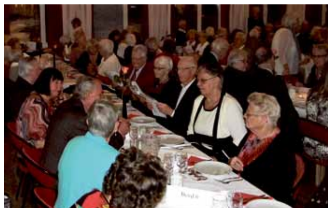
Fest i Föreningsgården.

! En förutsättning för att festen blir av är att tillräckligt antal personer anmäler sig!