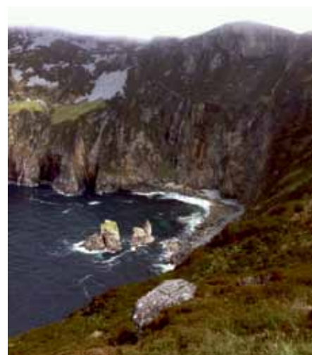
De dramatiska klipporna vid Slieve League.