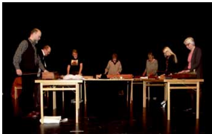
"En Sträng" spelar på psalmodikon.