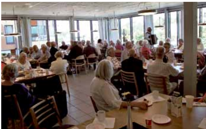
Sommarklädda 87-plussare i Utsikten.

Efter två timmars trevlig samvaro skildes vi åt efter att vi önskat varandra en skön sommar.