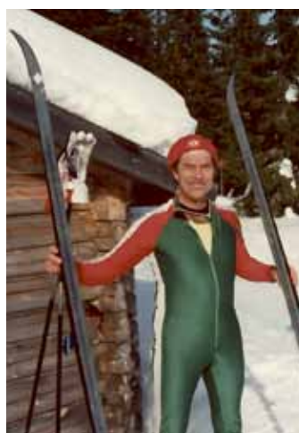
Skidliv med IF Linden.

” Gunhild är den vackraste flickan jag sett.