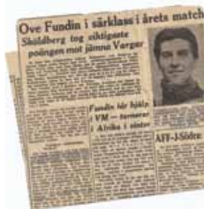
"Sköldberg tog viktigaste poängen mot jämna Vargar."