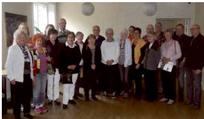
Nya medlemmar på informationsträff på Bygdegården.

Bollmoravägen 14, 135 40 Tyresö. Tel: 712 13 35 Öppet Mån-fre 9.00–19.00. Lör 9.00–15.00