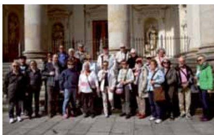
Resa i Berlin 6–9 maj 2015.