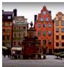
Stortorget i Gamla Stan.