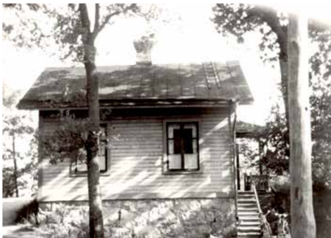
Barndomshemmet i Augustendal i Nacka, numera en del av Nacka Strand.