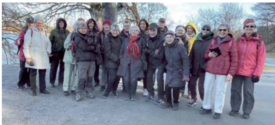
Bortsett från januari blev det inga fler promenader 1:a halvåret pga. covid-19. Men nu ska det väl komma igång.