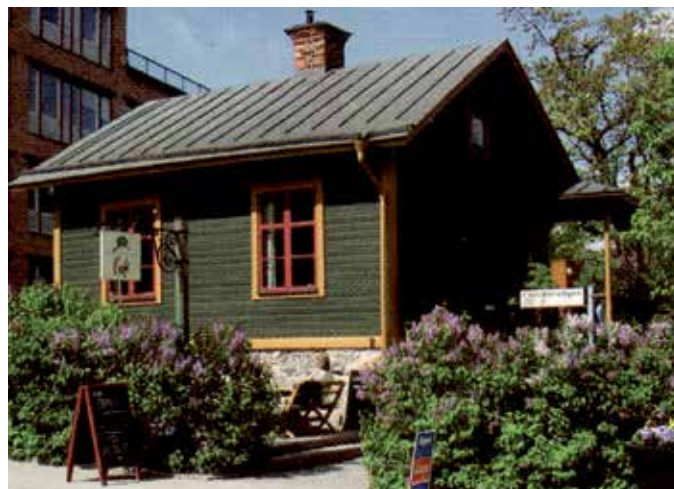
Huset i Augustendal som det ser ut i dag. Välbevarat och i många år tjänstgjorde det som kafé.