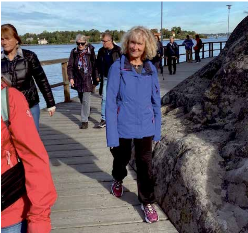
Promenadgänget vid Nacka Strand – Sickla .