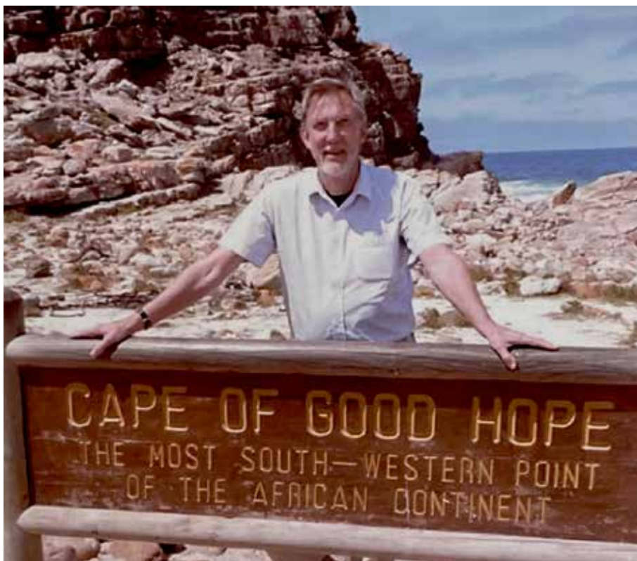
Sydafrikaresan 2008. Här i Cape Town.

Men den tekniske ingenjören hade också andra intressen än att installera radiolänkar för flyget och utrustning för kustartilleriet. Han gjorde Stockholm osäker med att köra en vespa, en