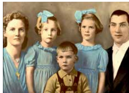
Familjefoto från slutet av 1940-talet. Syskonskaran utökades senare med en lillebror.