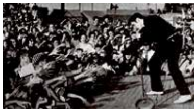
Elvis uppträder live vid "The Mississippi-Alabama Fairgrounds" i Tupelo, Mississippi, i september 1956.