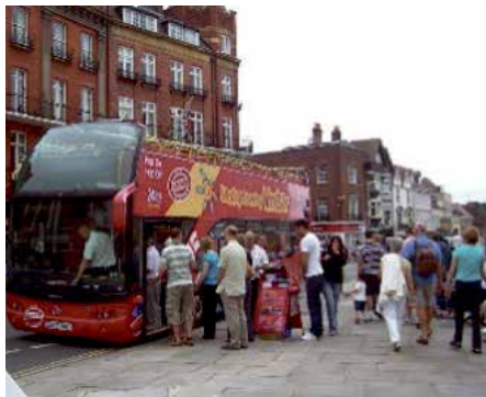
Vart är vi på väg?

OBS! Om du betalar för fler så namnge samtliga namn på betalningen.