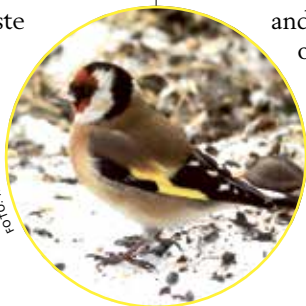
Att skilja en steglits från en undelat kan bli skogsägarnas nya bekymmer.

Rysslands diktator Putin visade natten till 24 februari att han är maktfullkomlig. Vi hade dagligen i medierna under januari och februari matats med uppgifter att "kriget står för dörren". Nu ansåg tydligen diktatorn att tiden var mogen att slå till mot Ukraina. Alla medier, med få undantag, har menat att det är Rysslands fel. Självklart är det Putins fel. Jag är ingen vän av rysk diktaturpolitik, men jämför man den med andra stormakters, så är det i mycket samma skrot och korn. Historien är full av exempel som förskräcker. Det tycks bara vara det ryska folket, som kan kasta ut Putin från sin position. Med hot om kärnvapen och repressalier från en despot, kan dörren till ett världskrig öppnas.