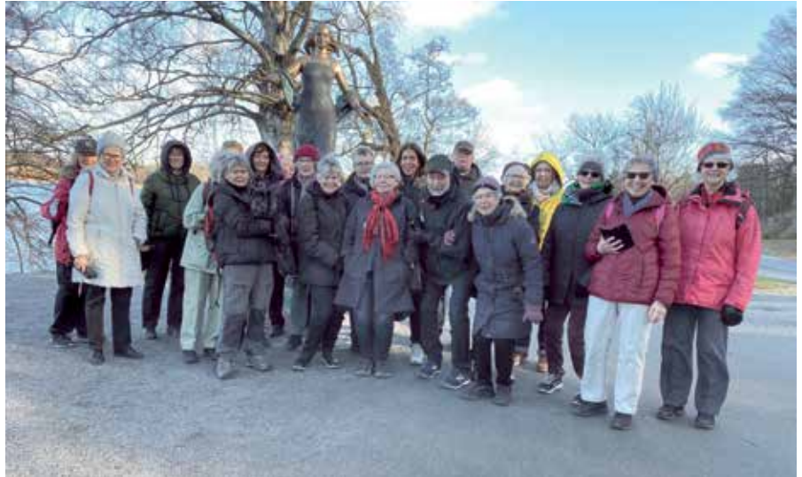
23 vandrare var med på den första vårpromenaden till Djurgården den 19 februari.