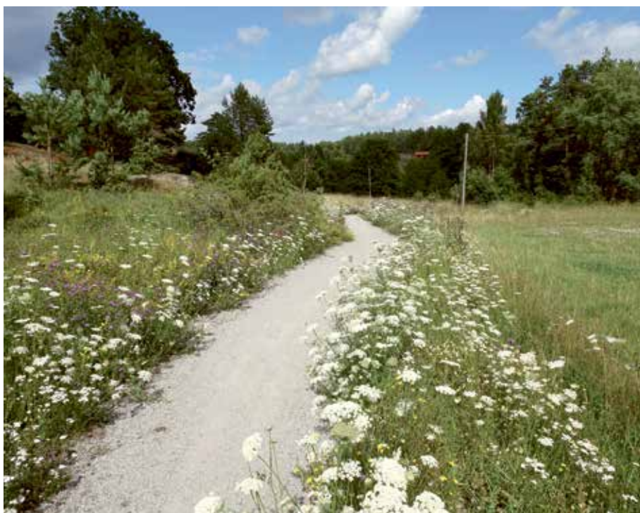
Möt vårens grönska i Vissvass.