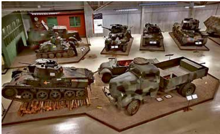
En del av den imponerande fordonsparken i Arsenalen.

PS. Denna dag lärde jag mig att pensionärer på bussresa är riktiga godisgrisar.