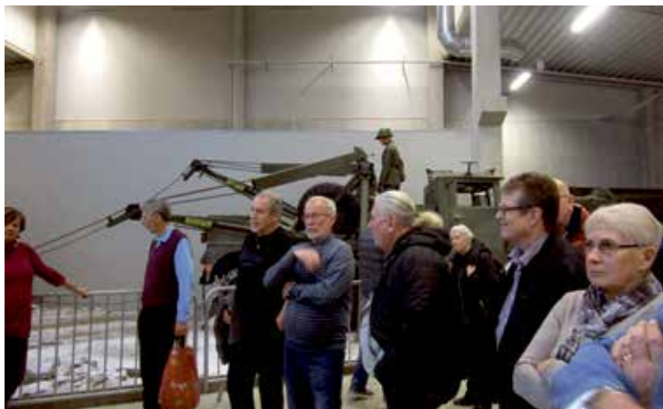
Fri vandring bland stridsvagnar och andra militära fordon.