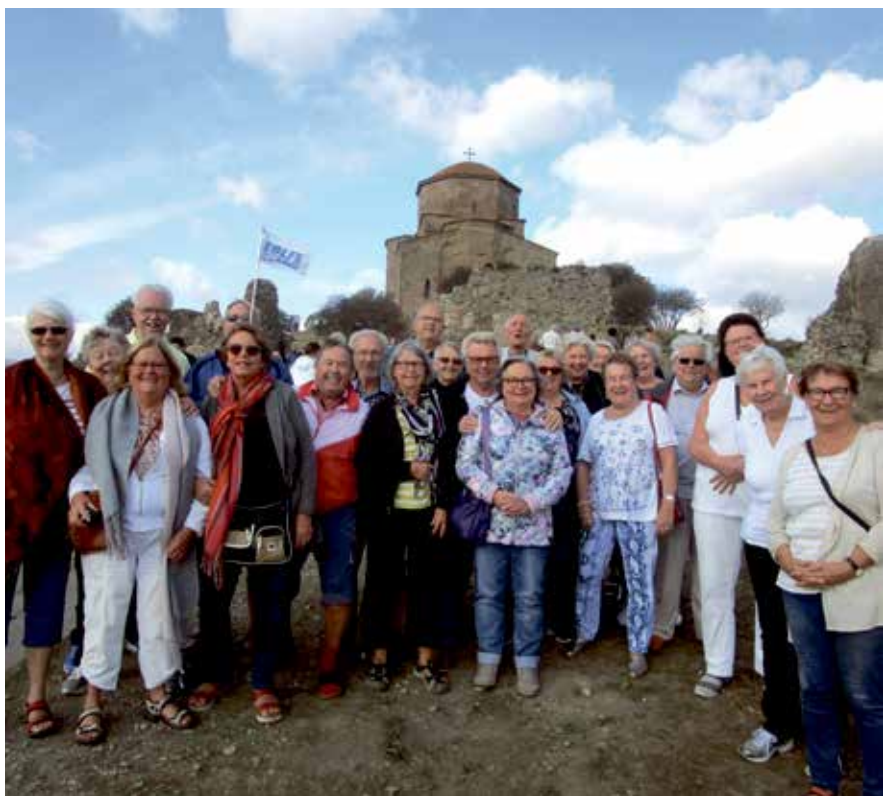
Hela gänget samlat med Trefaldighetskyrkan i bakgrunden, byggd på 1500-talet i bergen ovanför byn Gergeti.