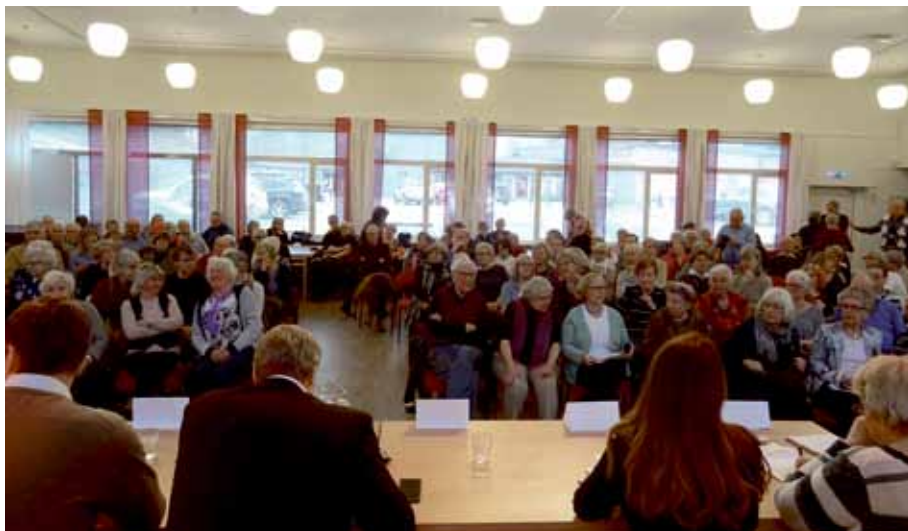
Nästan som tavlan "Blir du lönsam, lille vän?" av Peter Tillberg, 1972. FOTO: ANDERS LINDER