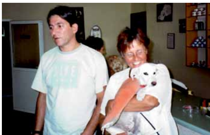
... och dito hund med gipsat ben.