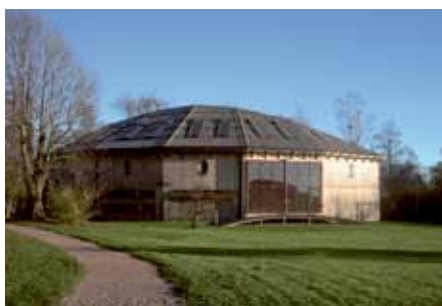
G:la Upsala museum.