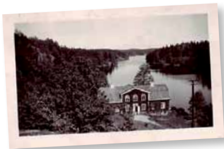
Vykortet visar hur Disponentvillan vid Nyforsvikens ände såg ut 1946.