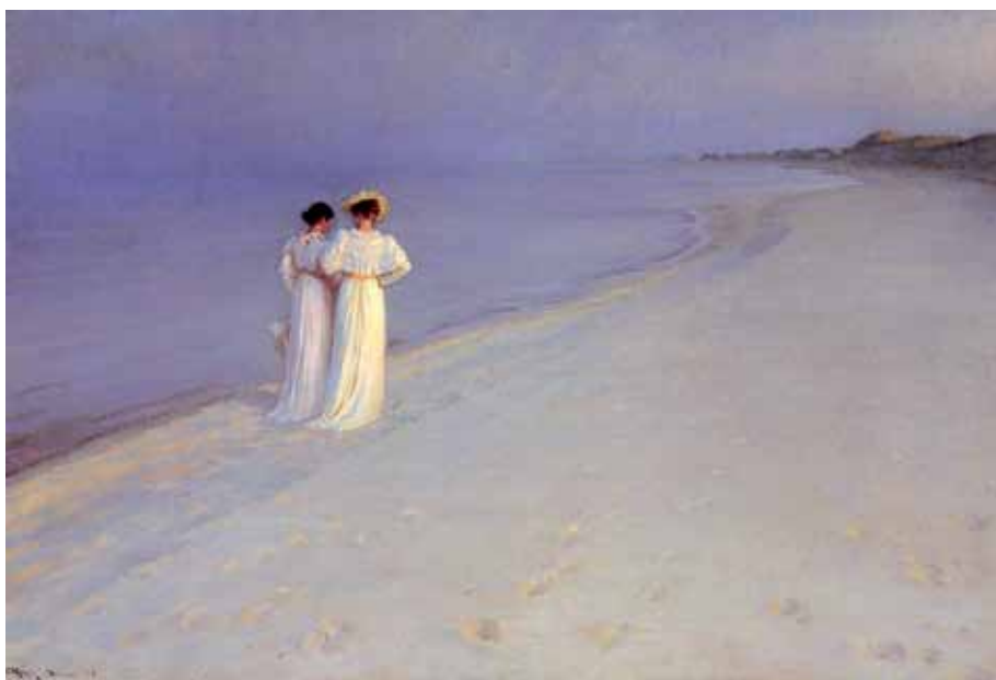
"Sommeraften på Skagens Sønderstrand" målad av Peder Severin Krøyer (1893).