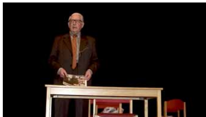
Tage G Petersson, fd försvarsminister.

På årsmötet behandlades frågor enligt stadgarna och styrelsen redovisade bl a verksamhetsberättelsen samt resultat- och balansräkning för år 2015. Trots en snäv budget kunde styrelsen redovisa ett mindre överskott för verksamhetsåret.