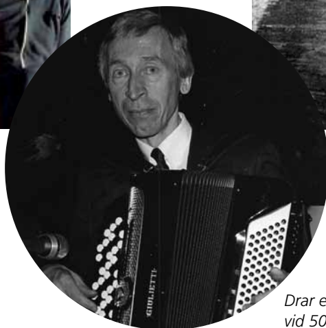
Drar en låt på dragspellet vid 50-årskalaset 1989.