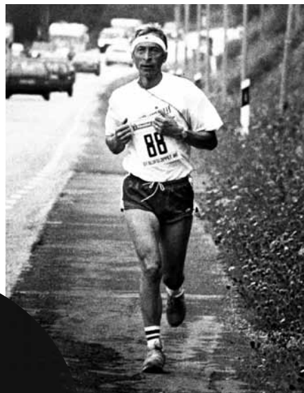
Avverkar en delsträcka i S:t Olofsloppet 1987.