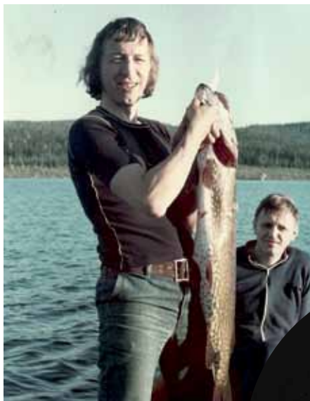
Fisketur i Jämtland på 1970-talet. Gammalgäddan vägde 10 kilo.