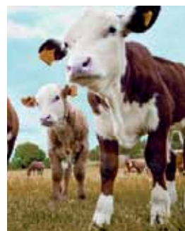
Kalvar på Uddby gård.