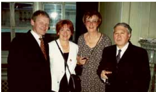
På kungamid- dag 1998.