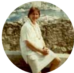
Monaco i maj.