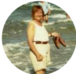
Skagen i augusti.