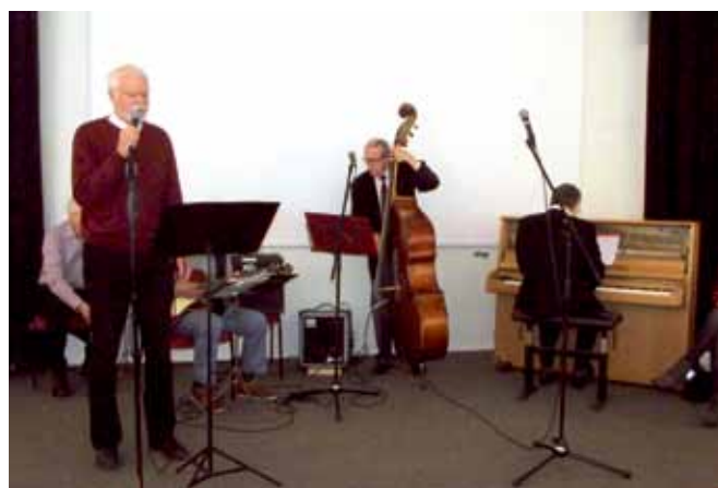
Spelglädjen tillbaka efter en tids uppehåll.