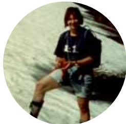
Bruksvallarna i juli.