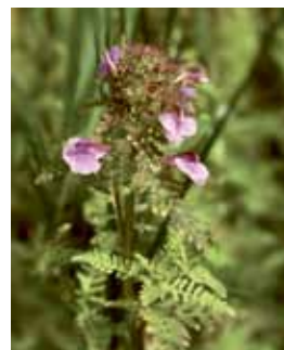
Kärnsyra har kommit fram tack vare arbetet på Dyviks lövängar.

Det kan komma till ytterligare aktiviteter senare. De kan du hitta på vår hemsida, adress: www.pro.se/tyreso . På månads-mötet i maj kommer även en förteckning på papper att delas ut.