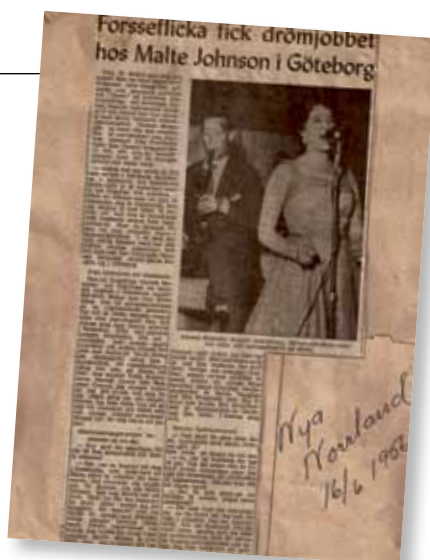
Ur Nya Norrland, 1956.