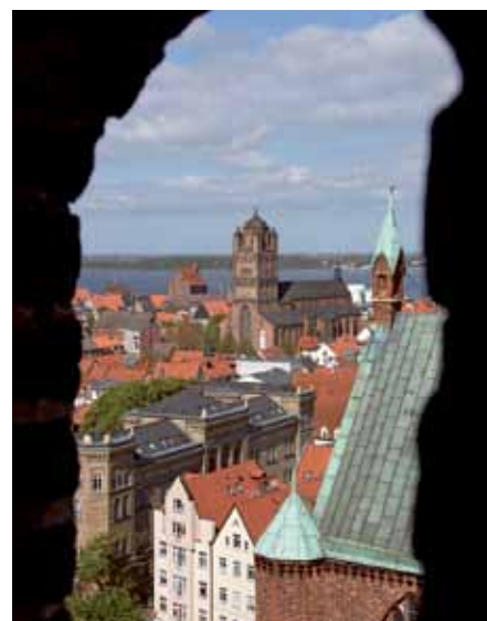
ST. JAKOBI-KIRCHE, STRALSUND

Anmälan och betalning görs senast den 17 juni till researrangören antingen via e-post, telefon eller brev med angivande av namn, adress, telefon och mobilnummer. Betalningen sätts in på plusgiro 27 41 30-4.