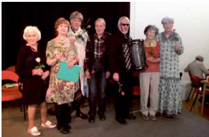
Teaterglädjen framförde "Spiksoppa"..