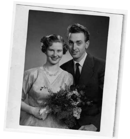
Brölloppet stod 1956 i prästbostaden i Vadsbro, Sörmland.

” Hur har karl'n orkat med allt? Man blir trött själv bara man tänker på det.