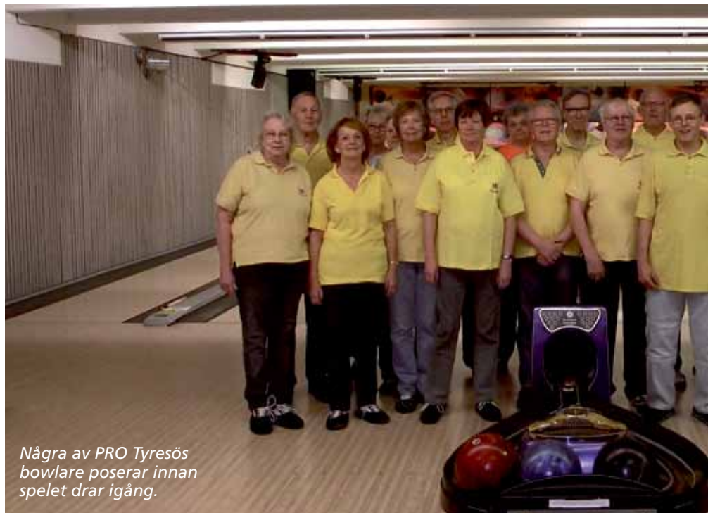
Några av PRO Tyresö bowlare poserar innan spelet drar igång.

Bowlingklubben Regina, Kägelklubben Record och AIK-bowlingsektion