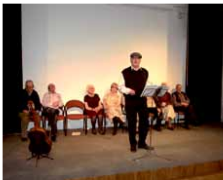
Teaterglädjen underhöll med musik och dikter av Nils Ferlin.