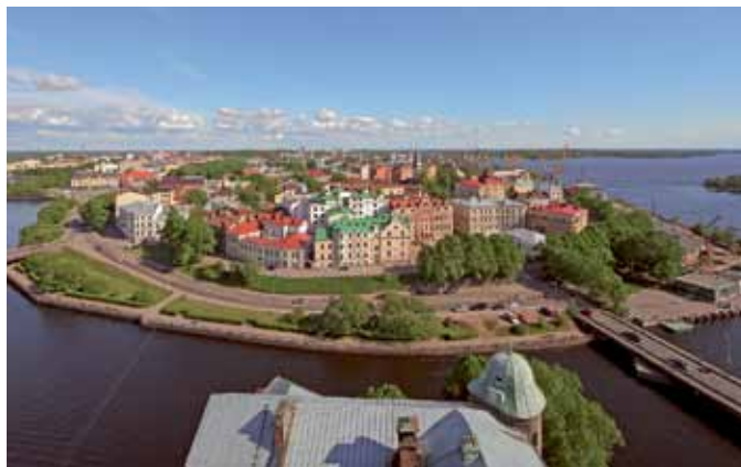
Viborg från ovan.

Ni som inte kan delta ring TG resor 018-15 15 40.