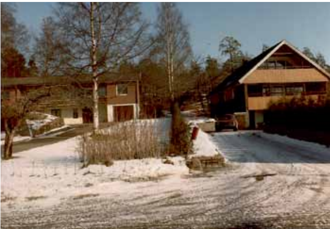
Husen i Trollbäcken.

” Hur har karl'n orkat med allt? Man blir trött själv bara man tänker på det.