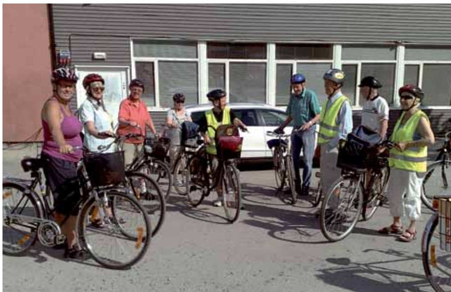
Avfärd från Föreningsgården.