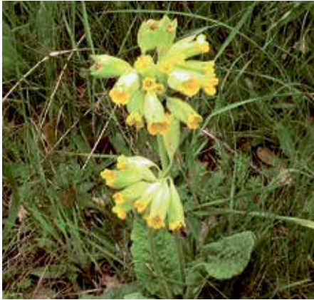
"Gullviva, mandelblom, kattfot och blå viol..."