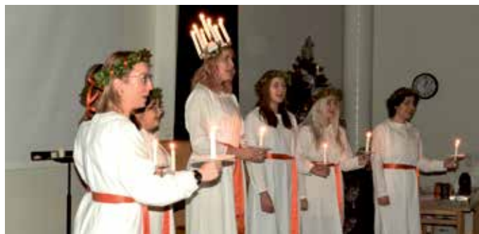
Luciatåg med Tyresö Vokalensemble.