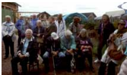
Vi lyssnar på PÅ, silversmeden.