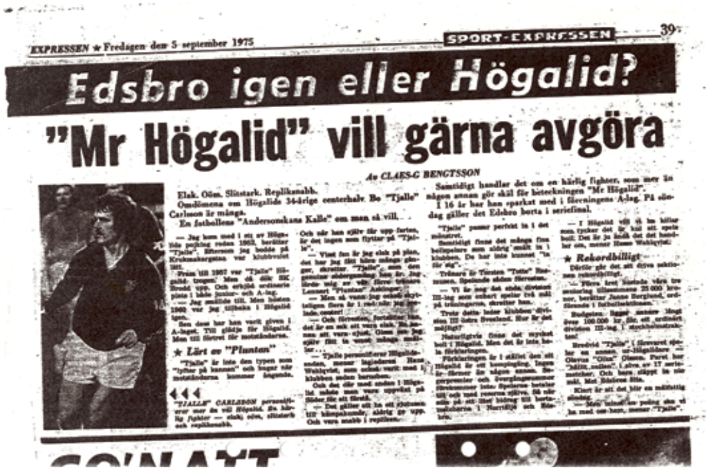
I Expressen den 5 september 1975 berättades om Bosses fotbollskarriär och hans engagemang för klubben Högalid.