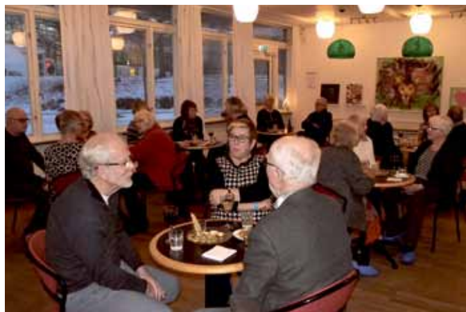
Träff med nya medlemmar.