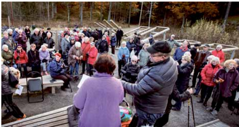
Upprörda PRO:are vid utegymmet.