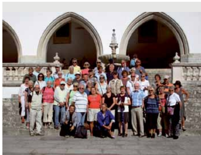
Gruppen i världsarvsstaden Sintra.

Under fyra dagar besökte vi Skagen med dess fantastiska museer, "Grenen" där Skagerack och Kattegatt möts och en fantastisk solnedgång vid gamla Skagen. Vi hann även besöka "Den tillsandade kirke" och en rovfågelsuppvising.