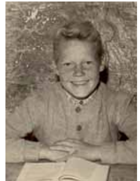
Pluggar på järnhandlarskolan 1956.