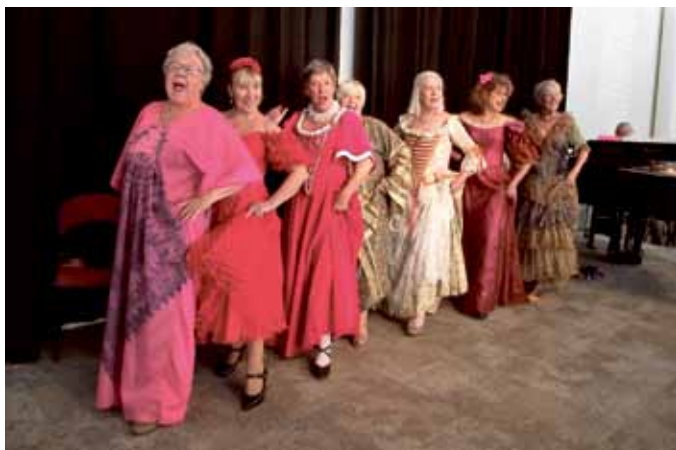
Operadonnorna fick stående ovationer.