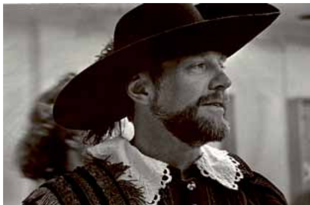
Magnus Gabriel De La Gardie, Tyresöspelet.