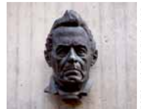
Franz Berwald vid entrén. Av Carl Eldh, rest 1979.

Bindande anmälningar till Birgitta Magnusson, telefon 08-7126069, 070-6511731 eller e-post birgitta_magnusson@bredband.net senast den 6 februari. Betalning till PRO:s plusgiro 269101-2 eller bankgiro 809-5283 senast den 10 februari. Glöm inte att skriva ditt namn och vad det gäller.