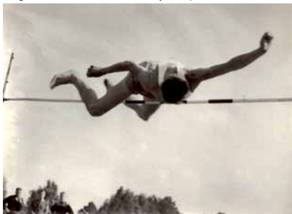
Högt över trädtopparna med dykstil.