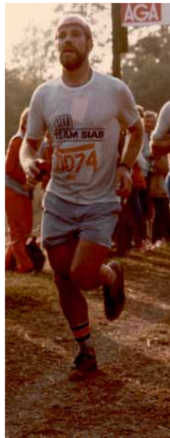
Först i spåret i Lidingöloppet