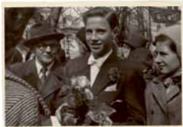
Konfirmand i Maria kyrka 1952.