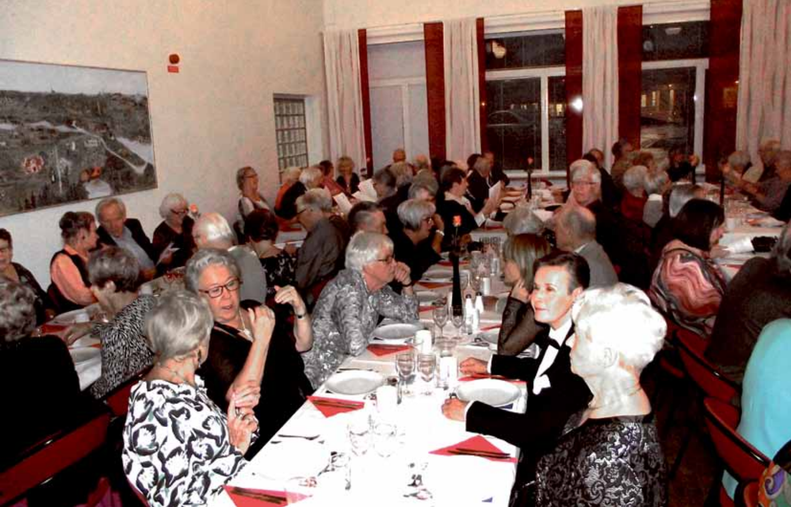
Fullsatt vid borden på PRO Tyresös 60-årsfest. Läs mer på sidan 16.