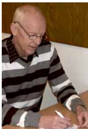
... Rune kryssar på.