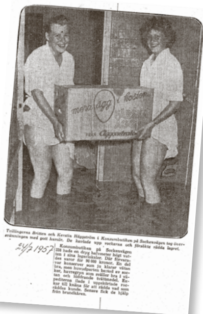
Tvillingarna räddar äggkartonger från en översvämning på Konsum 1957.