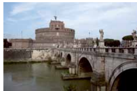
Casa del Angelo och Änglabron.

Andra sevärdheter som besågs var fontänen där Anita Ekberg plaskade omkring en gång, Fontana di Trevi, och överallt rester av de väldiga akvedukterna som en