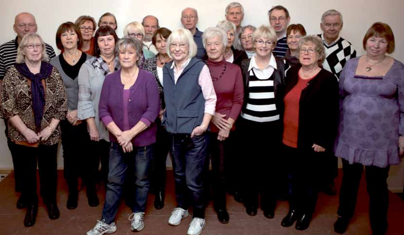
Trivsamt träff för nya medlemmar 28 oktober.