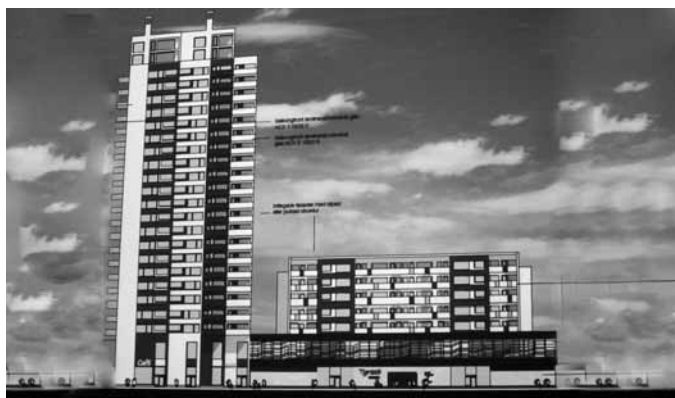
30 nov Arkitektens bild av de nya höghuset i Tyresö centrum. Byggstart i början av 2012.