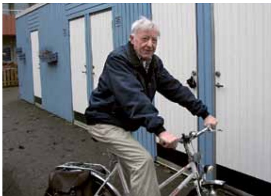
Sture parkerar cykeln till i vår.