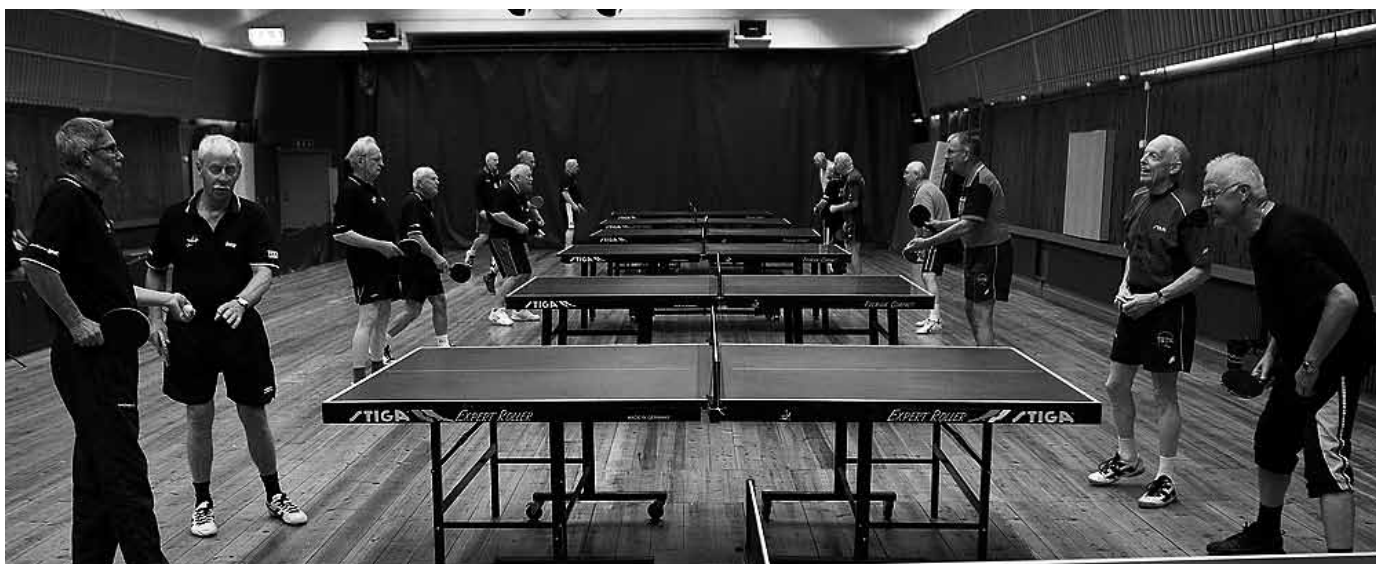
Snart servas det på alla borden.