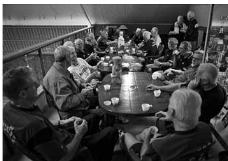
Rast på läktaren.