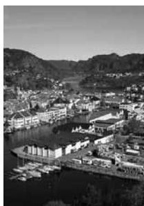
Stadskärnan i Flekkefjord präglas av trähus från tidigare epoker.