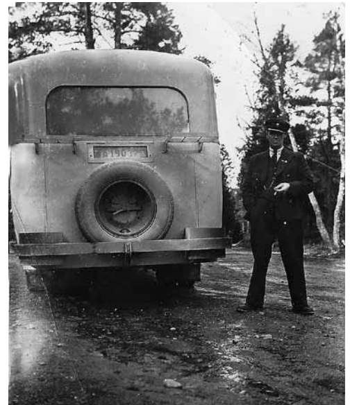
Fadern var busschaufför.