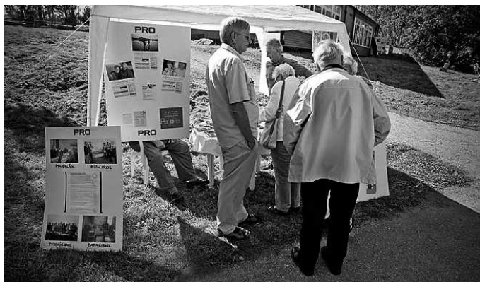
3 sept PRO Tyresö deltog på Tyresöfestivalen med tält och information om verksamheten.