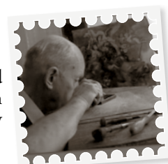
Mästergravören Czesław Slania.

Anmälan till Roland Albinsson senast den 6 mars 2012 på tel. nr 712 36 91 alt. 070-091 98 28.